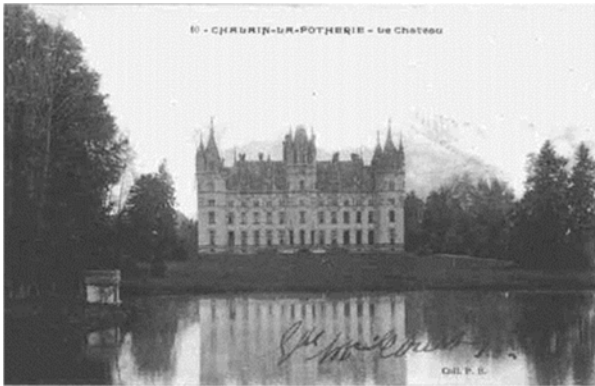
l'actuel château de Challain, en 1902 (carte postale, collection perso)

Deux frères Bazin s'installent forgeurs à Challain vers 1630. Il y a eu avant eux des Babin, forgeurs à Challain, mais ils viennent alors de s'éteindre, comme je l'observe dans le chartrier de Challain.