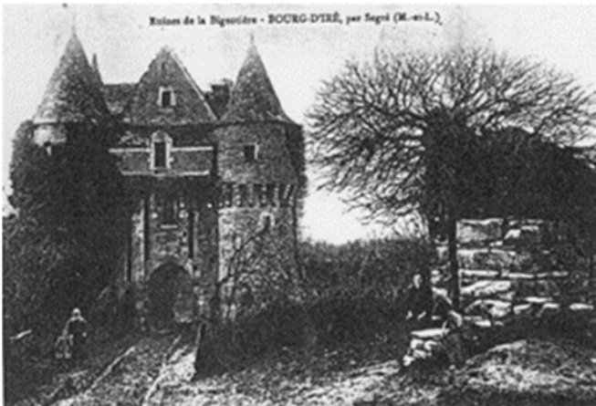
ruines du château de la Bigotière

Thugal Conrairie est régisseur au château de la Bigotière au Bourg-d'Iré.