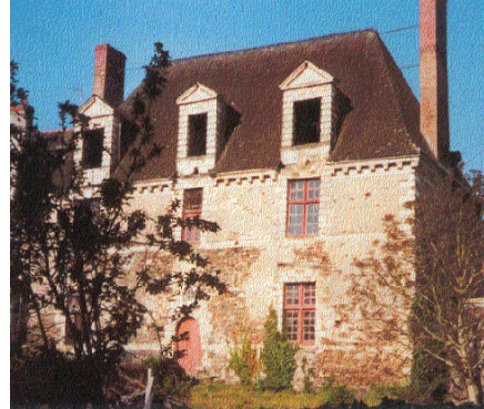
restes de l'abbaye de Nyoiseau (1997)

Nyoiseau 1 : 419 Nyoisiens en 1720, 1 416 aujourd'hui. La paroisse, possédée en grande partie par l'abbaye, dépendait du doyenné de Craon & du grenier à sel de Châteaugontier. Le bourg « assemblage informe & inabordable jusqu'en 1830 de sombres logis, enclavé dans les dépendances de l'abbaye, perdu dans un pays de friches & bruyères, que la route stratégique a transformé », était un refuge pour les mendiants attirés par les charités des religieuses.