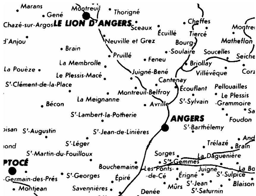
anciennes paroisses de l'Anjou (extrait de la carte - les traits figurent les rivières et non les routes) StJean-des-Mauvrets et en bas à droite près Erigné - Gené est haut à gauche du Lion-d'Angers