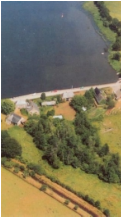
site des forges de la Provostière à Riailé

Les ouvriers des forges étaient tous des spécialistes, que l'on déplaçait au gré des besoins des diverses forges en spécialistes, du Maine à la Bretagne en passant par le pays de Châteaubriant.