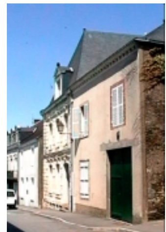
maison Lescouvette aujourd'hui (à droite, avec l'enseigne au dessus du porche ancienne boutique)

L'origine sociale est parfois clairement exigée dans les Statuts des Corporations. Ainsi à Nantes en 1720 on ne prend comme apprenti « aucun enfant qui soit sorti de gens vils et mécaniques ». Les apprentis se recrutent dans la bourgeoisie riche des villes, souvent fils d'apothicaires ou chirurgiens. A partir du 18 e on rencontre aussi des fils d'épicier ou droguistes, peu de nobles. A Nantes en 1672, trois notables doivent attester que l'apprenti appartient bien à la religion catholique. »