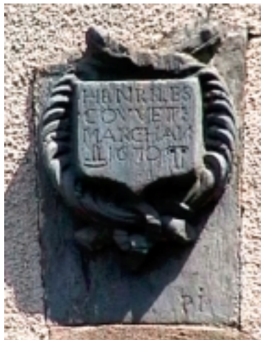
enseigne de la maison Lescouvette à Pouancé

L'enseigne ci-après est au dessus du porche, sur le mur de la maison Lescouvette, et donne 2 dessins dont je recherche la signification.