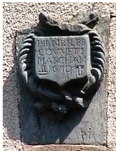
enseigne de la maison Lescouvette à Pouancé (Photo O. Halbert 1999)

Les Lescouvette sont apothicaires et chirurgiens. Ils ne sont pas les premiers à Pouancé, l'une des rares villes d'Anjou à avoir un apothicaire dès la fin du 16 e .