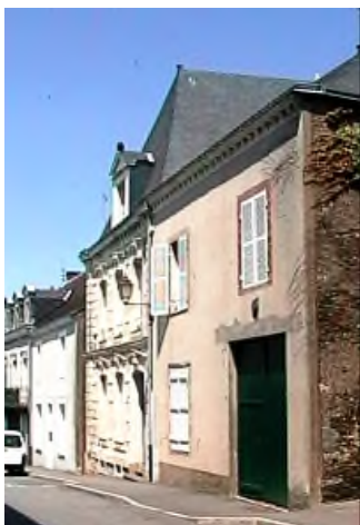
maison Lescouvette aujourd'hui (à droite, avec l'enseigne au dessus du porche ancienne boutique)

Les enseignes sont nécessaires pour se distinguer des autres marchands. Dans notre région, selon une publication Nantaise, les enseignes des apothicaires de l'époque illustrent le nom et non la profession. Ainsi, le poisson de la célèbre maison à pans de bois dans la douvre à Angers, construite en 1582 par Simon Poisson apothicaire. Doit-on voir un balai ou un instrument de pharmacie ?