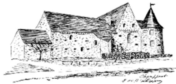
L'ancien château de Champjust à Chazé-Henry