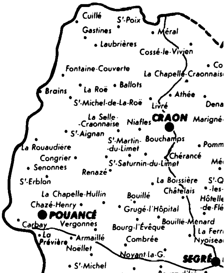
extrait de la carte des paroisses d'Anjou au 18 e siècle (limites de l'Anjou en gros trait & rivières en trait fin)