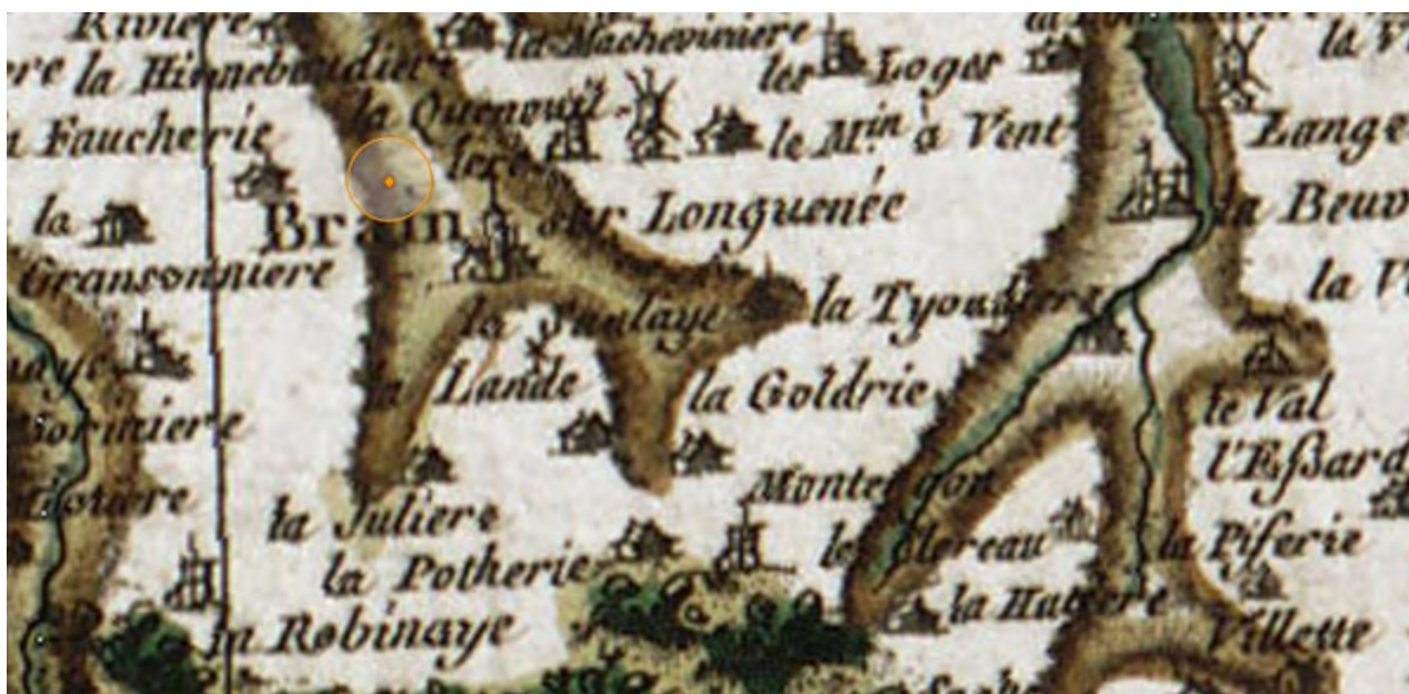
le Clereau est situé sous Montergon (carte de Cassini début 19ème siècle)