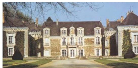
château de la Lorie, en 1998

La branche dont je descends est celle de La Chapelle-sur-Oudon où les Roynard sont probablement tisserands de lin, mais peu d'indications de métier à ce jour. La culture et le tissage du lin font alors vivre une partie de la population dans cette région.