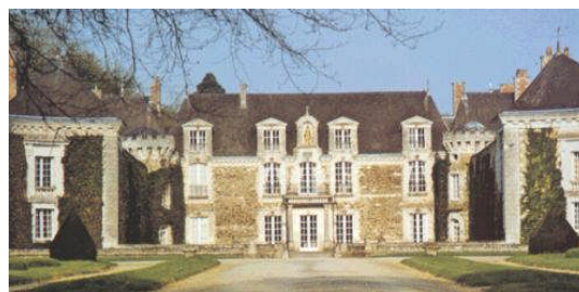
château de la Lorie, en 1998

La branche dont je descends est celle de La Chapelle-sur-Oudon où les Roynard sont probablement tisserands de lin, mais peu d'indications de métier à ce jour. La culture et le tissage du lin font alors vivre une partie de la population dans cette région.