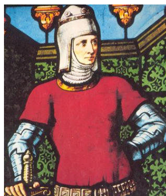
Ollivier de Clisson

Ce fut la r sidence de campagne pr f r e du conn table Olivier de Clisson qui entretenait une meute, des faucons, puis des parcs   faisans et   perdrix.