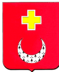
Armes de la commune de Treffieux « de gueules au croissant d'hermine surmonté d'une croissette d'or dordurée d'argent » Brisure du blason de la seigneurie de Vay.

La commune comptait 603 habitants en 1790, 525 en 1835 et aujourd'hui 635.