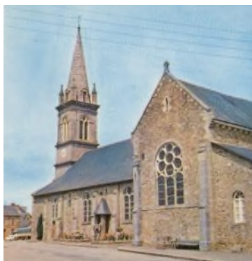
l'église de Merdrignac aujourd'hui