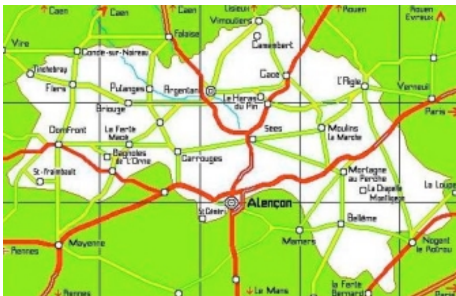
le département de l'Orne (61)

On compte 52 porteurs du patronyme CHABLE dans l'Orne en 2002 dans l'annuaire France-Telecom, mais plus aucun à Faverolles ou au Grais.