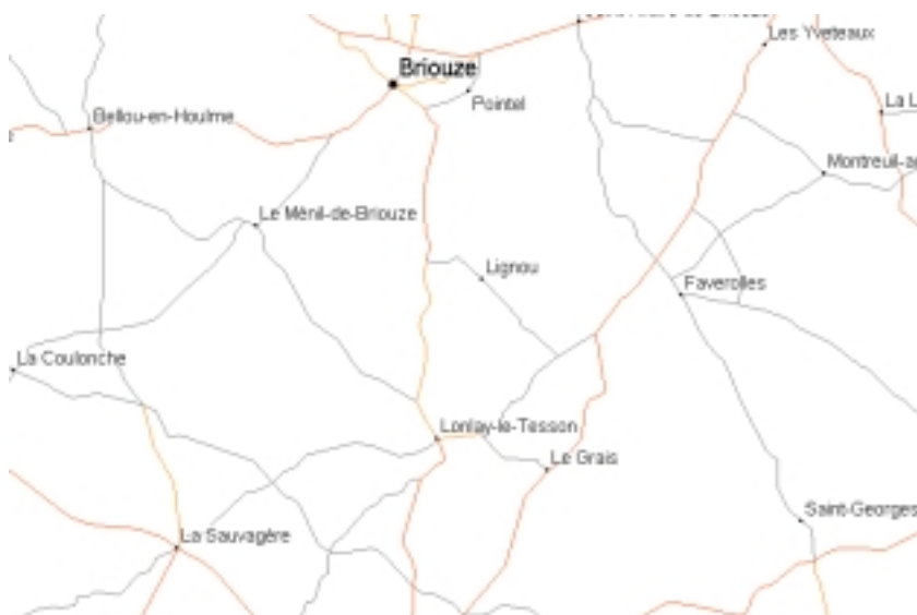
Le Grais et Faverolles, proches de la Sauvagère et La Coulonche