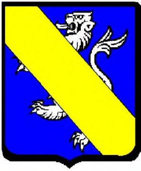
« d'azur au lion d'argent, à la bande d'or brochante sur le tout »

Or, au cours de mes multiples travaux, notamment en Haut-Anjou, j'ai rencontré un grand nombre de cadets de familles très notables, voire nobles, qui descendaient socialement. En particulier chez les nobles, du fait du partage qui privilégie l'aîné au détriment des cadets !