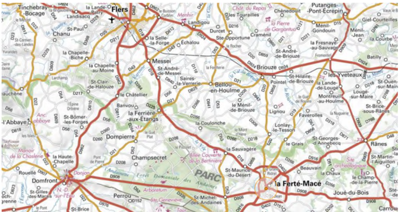
La Coulonche, au centre de cette carte IGN, se trouve entre Flers et La Ferté-Macé