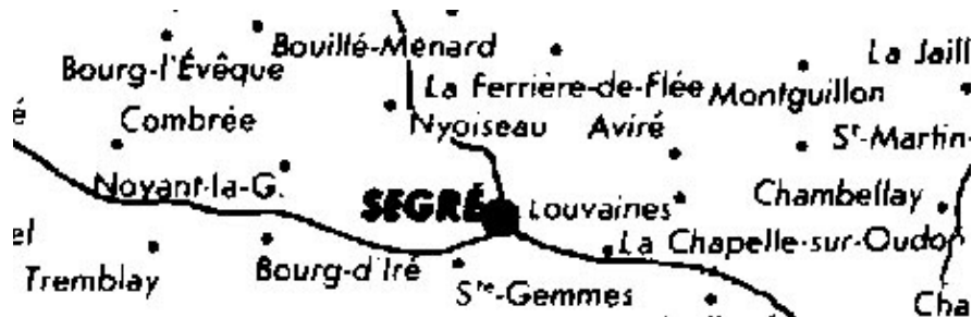
Saint-Aubin-du-Pavoil, aujourd'hui disparue, était entre Segré et Nyoiseau.