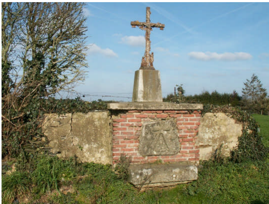
Pierre d'autel et fronton de la chapelle, posés en un calvaire après sa démolition

Le Dictionnaire du Maine et Loire de Célestin Port, 1 ère édition donne : « La Gatelière - Il y existait une chapelle de St Avertin, détruite à la Révolution. La pierre de l'autel est déposée devant la porte de l'église paroissiale et la petite cloche, pesant 30 kg, dans le clocher 1 . »